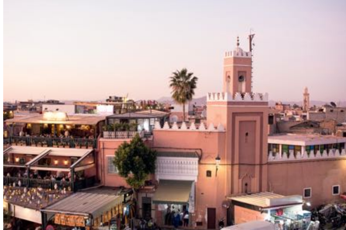
Boven: Djemaa el Fna. Links: de Majorelle-tuin. Onder: kruidenmarkt in Marrakesh.