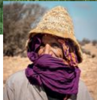
Rechtsboven: Ouirgane. Links: de stadsmuren van Taroudant. Midden: een schaapherder in Taliouine. Onder: Tiznit.