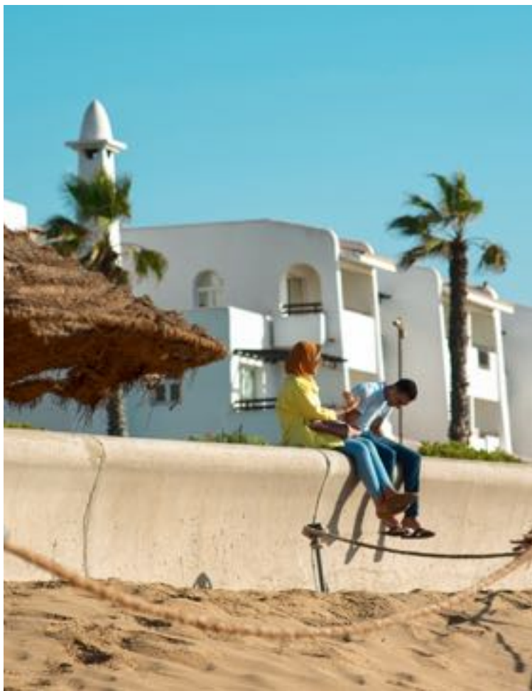
De boulevard van Agadir.

Er gaan dagelijks vluchten vanuit Brussel naar Marrakesh en Agadir, de vlucht duurt ongeveer 3,5 uur. Beste reistijd voor het binnenland is het voor- en najaar. Aan de kust is het ook in juni, juli en augustus aangenaam, maar in het binnenland kan het erg heet worden, tot zo'n 45 graden. De meeste regen valt in september en oktober.