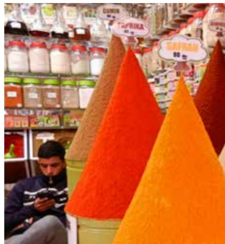
Volop kruiden te koop in de souk