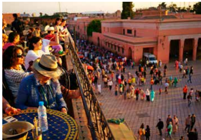
Uitzicht op het Djemaa el Fna-plein in het centrum

Huwelijksmousse “Op een geheime datum mogen huwbare nomadenvrouwen in Imilchil een man uitkiezen om mee te trouwen. Op de jaarmarkt zie je dat er veel geflirt wordt en er koppeltjes ontstaan. Daarna trouwen ze op een geheime plek. Een vrolijk ritueel waar wij als weinigen bij mogen zijn.”