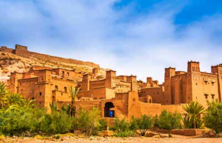
Aït-Ben-Haddou in de buurt van Ouarzazate is een favoriet filmdecor