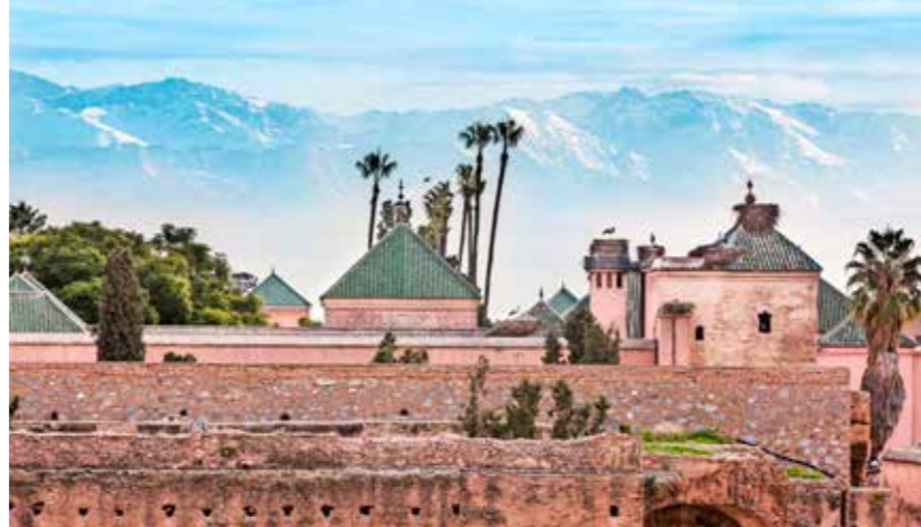
Uitzicht vanuit het El Badipaleis op het achterliggende Atlasgebergte