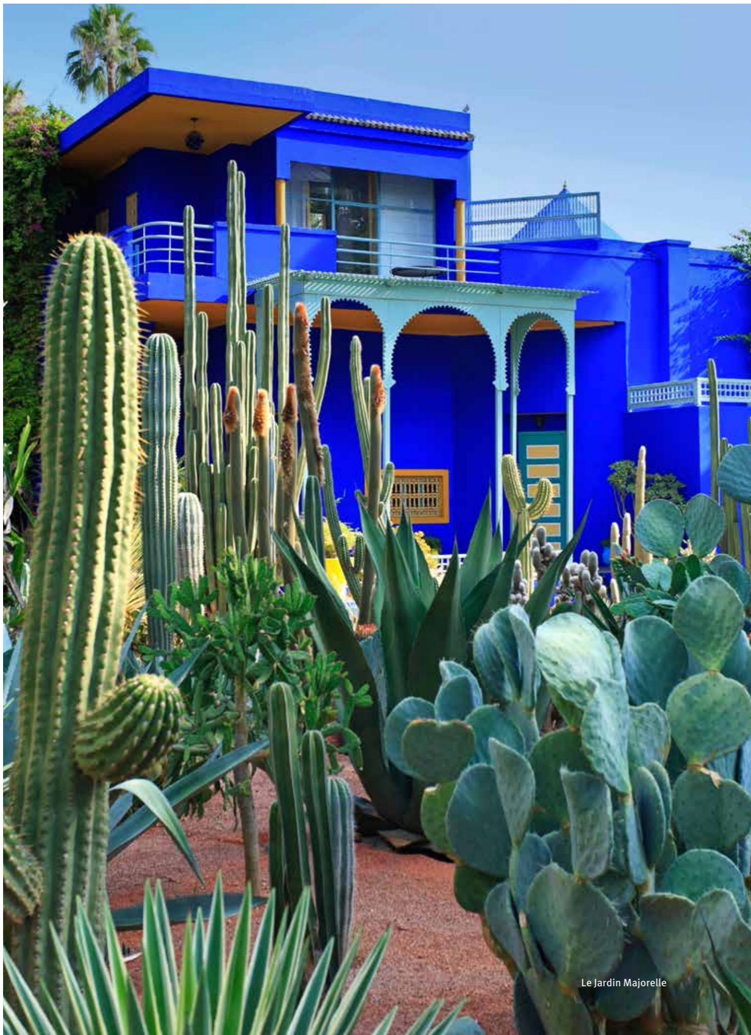
Le Jardin Majorelle