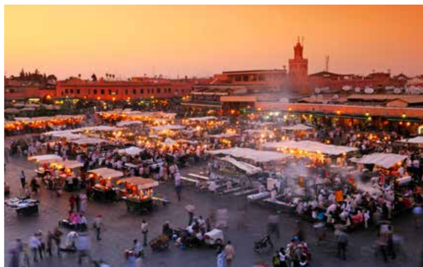
Djemaa el Fna, het grote plein in Marrakesh