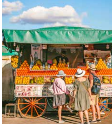
Vrouw bij een fruitkraam in de souk