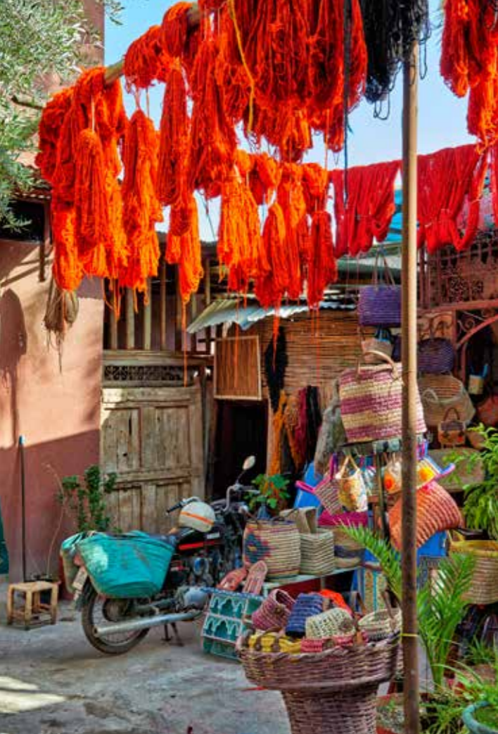
Op de souk hangt de wol te drogen die net geverfd is