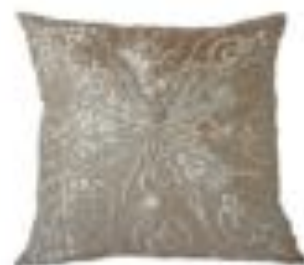
www.elramlahamra.nl Serkussen € 45,-