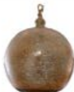
www.ill.nl Marokkaanse hanglamp € 312,50