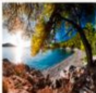
www.travelbits.nl Eilandhoppen Sporaden v.a. € 409,-