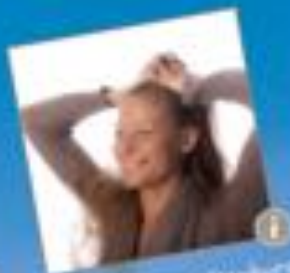
door Dionne Mitterburg