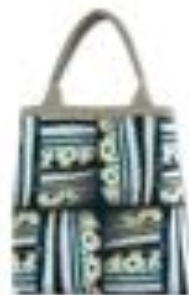
www.pillah.nl Tas Marrakech € 54,95